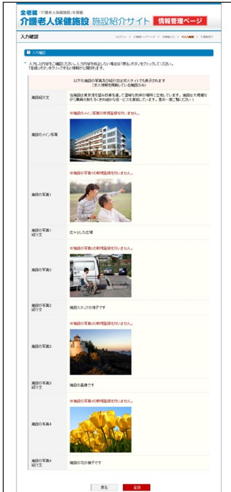
▲入力確認ページ（施設概要）