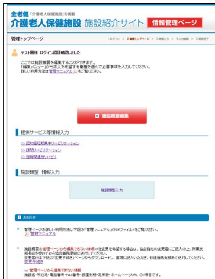
▲管理トップページ

編集する場合は「施設概要編集」のボタンまたは「提供サービス等情報入力」の各項目をクリックします。