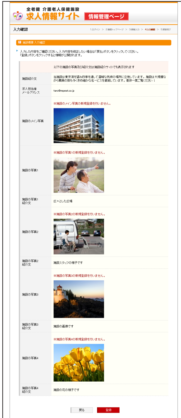
▲入力確認ページ（施設概要）